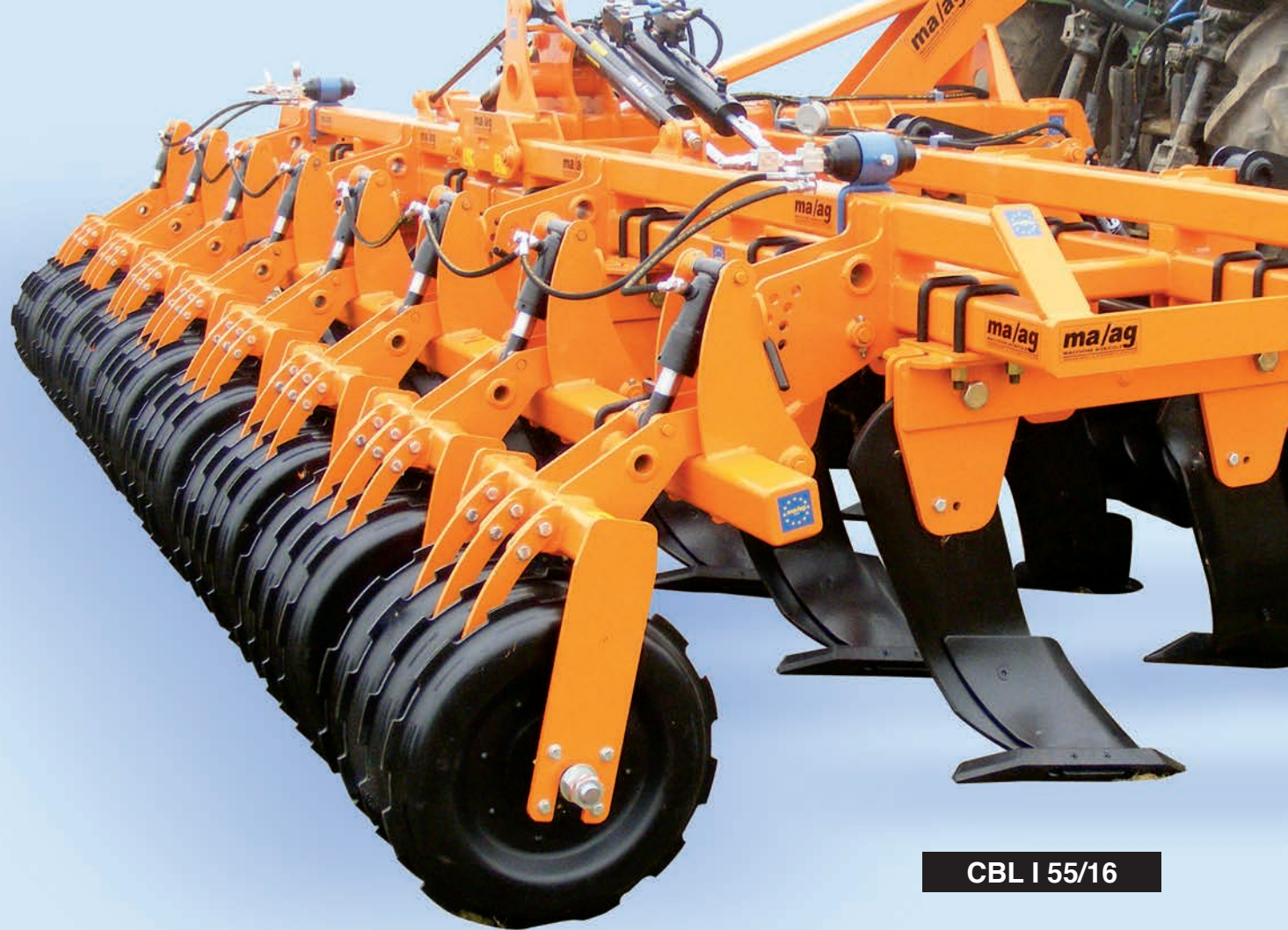
CBL I 55/16