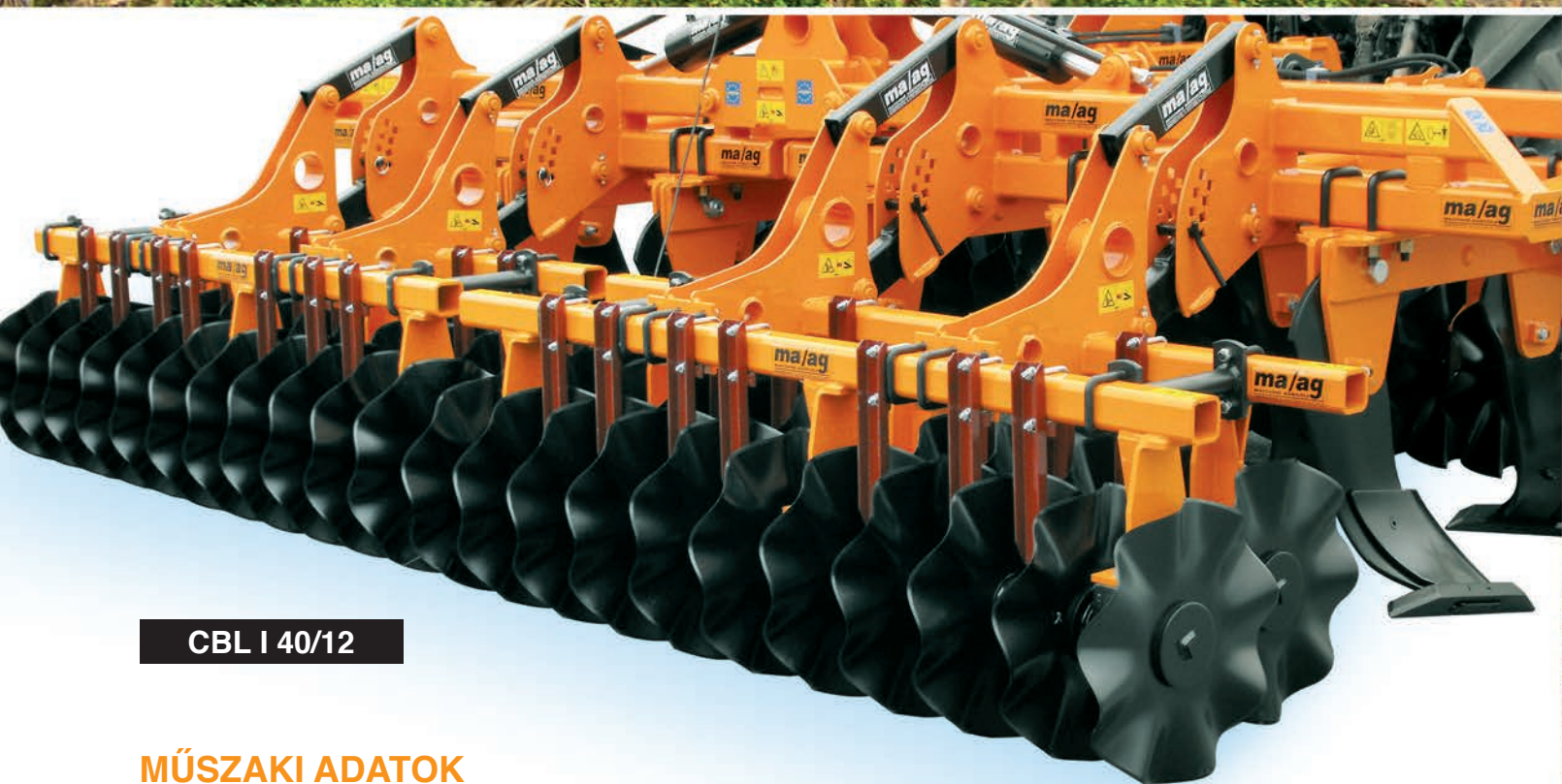
CBL I 40/12