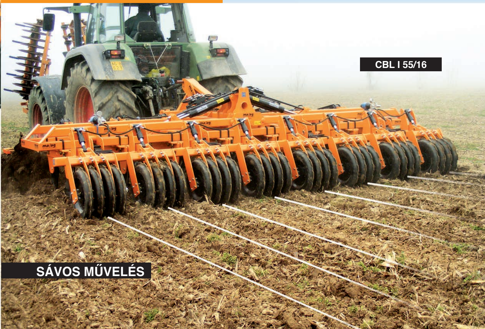
CBL I 55/16

BERENDEZÉS SAJTOLT ACÉL HENGERREL, DUPLA APRÍTÓ TÁRCSASOR NÉLKÜL