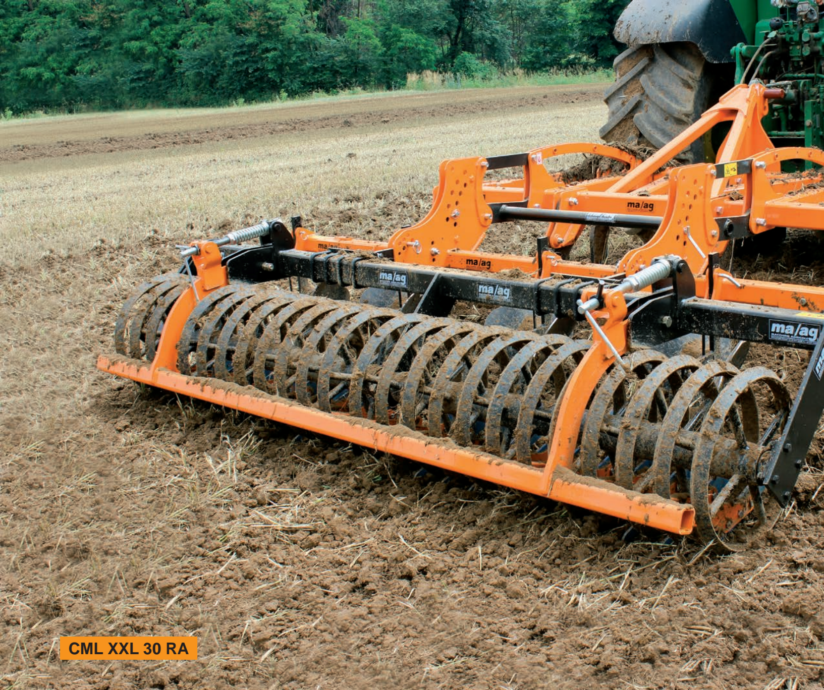
CML XXL 30 RA